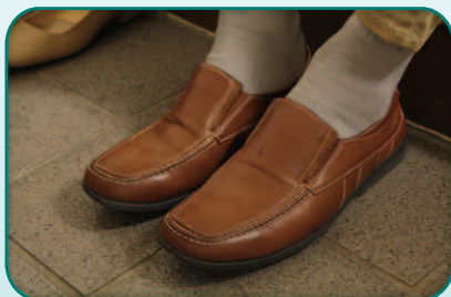
フラットシューズなど